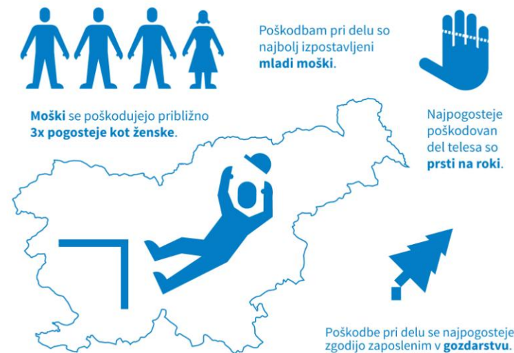
2.5.1 Graf 2: Najpogostejše poškodbe pri delu po spolu, vzroku, gospodarski dejavnosti in delu telesa, Slovenija, 2016

Viri: NIJZ5 – Evidenca poškodb pri delu (PPD)