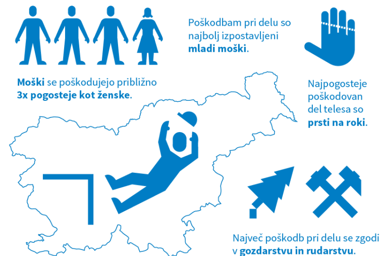
2.5.1 Graf 2: Najpogostejše poškodbe pri delu po spolu, vzroku, gospodarski dejavnosti in delu telesa, Slovenija, 2013